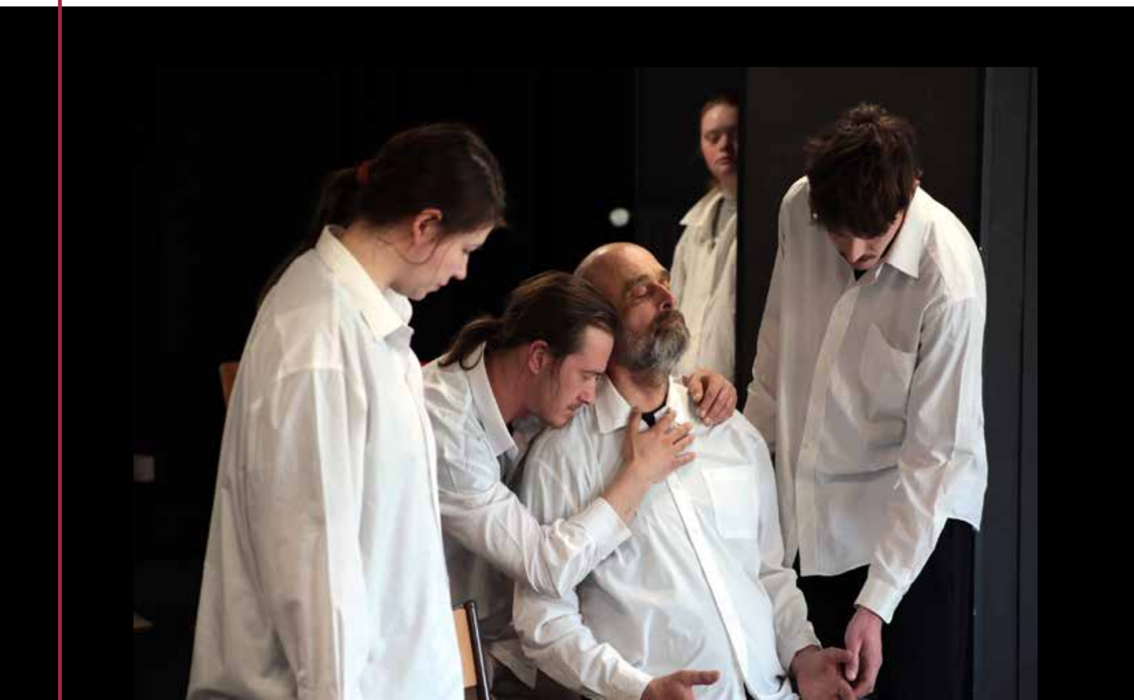
ProdART - Tout va bien / La Mue du Lotus Nancy avril 2025 ©Régis Bourguignon