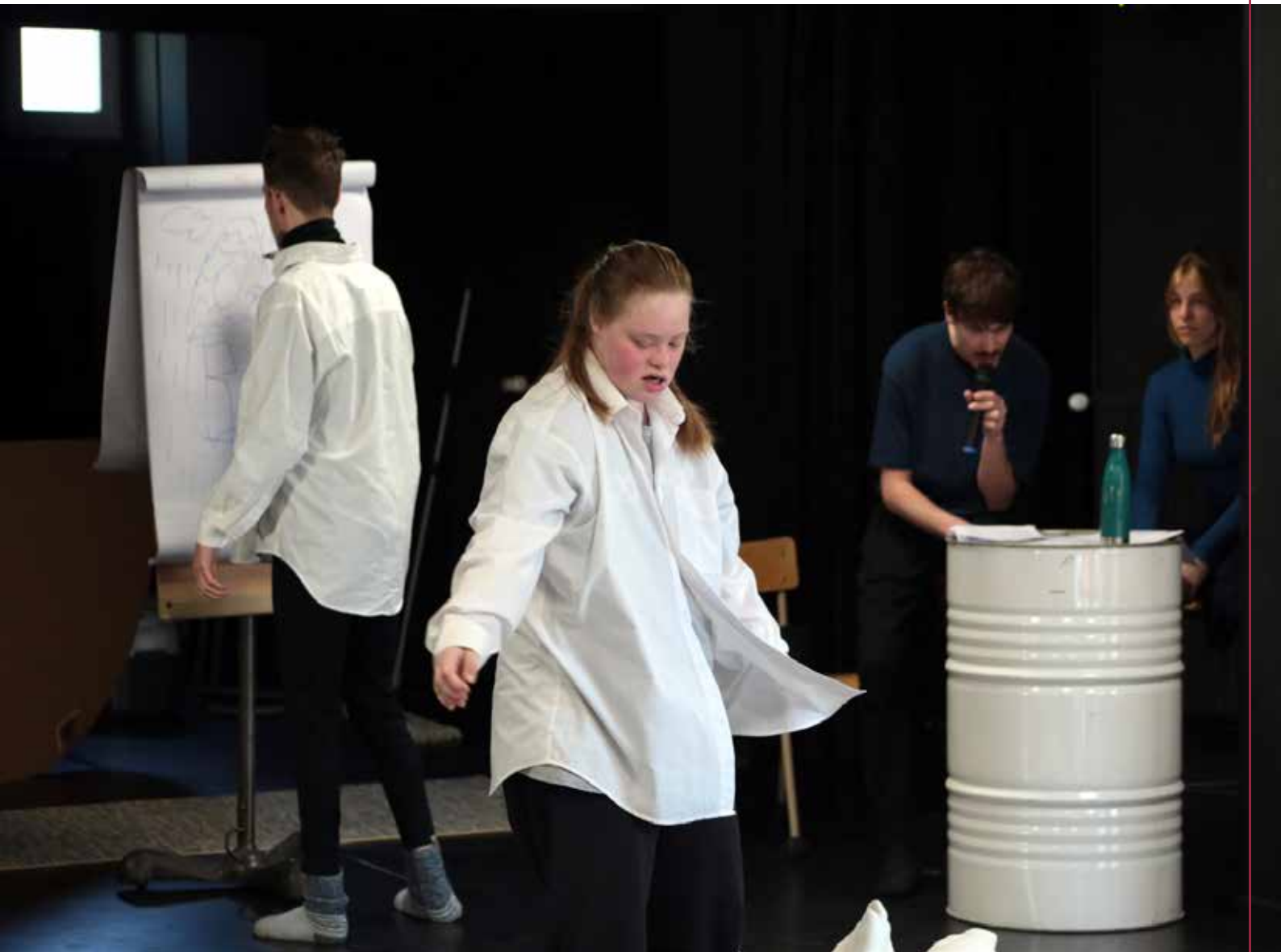
ProdART - Tout va bien/La Mue du Lotus - avril 2025 Nancy ©Régis BOURGUIGNON