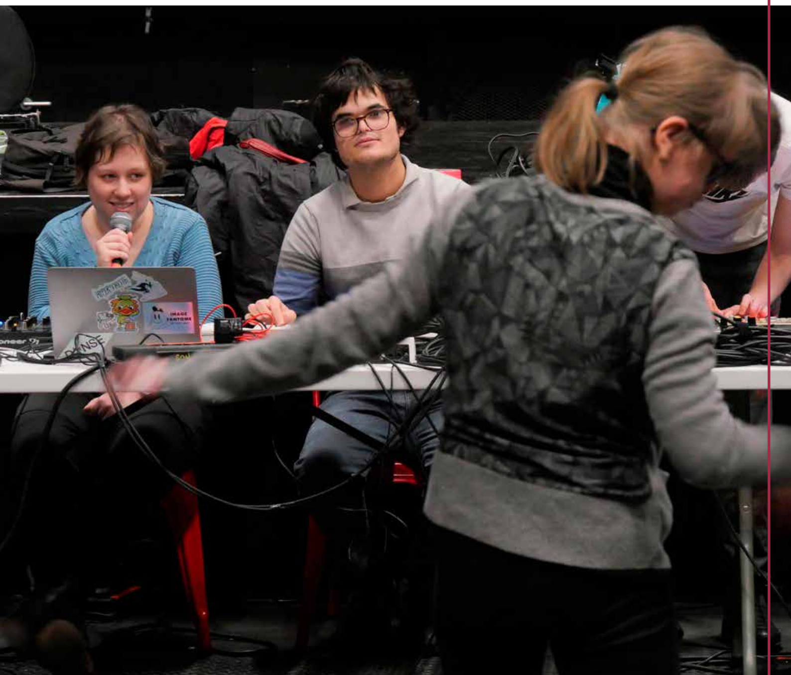
Ateliers INDIGO - Tout va bien / La Mue du Lotus - mars 2024 L'Autre Canal Nancy