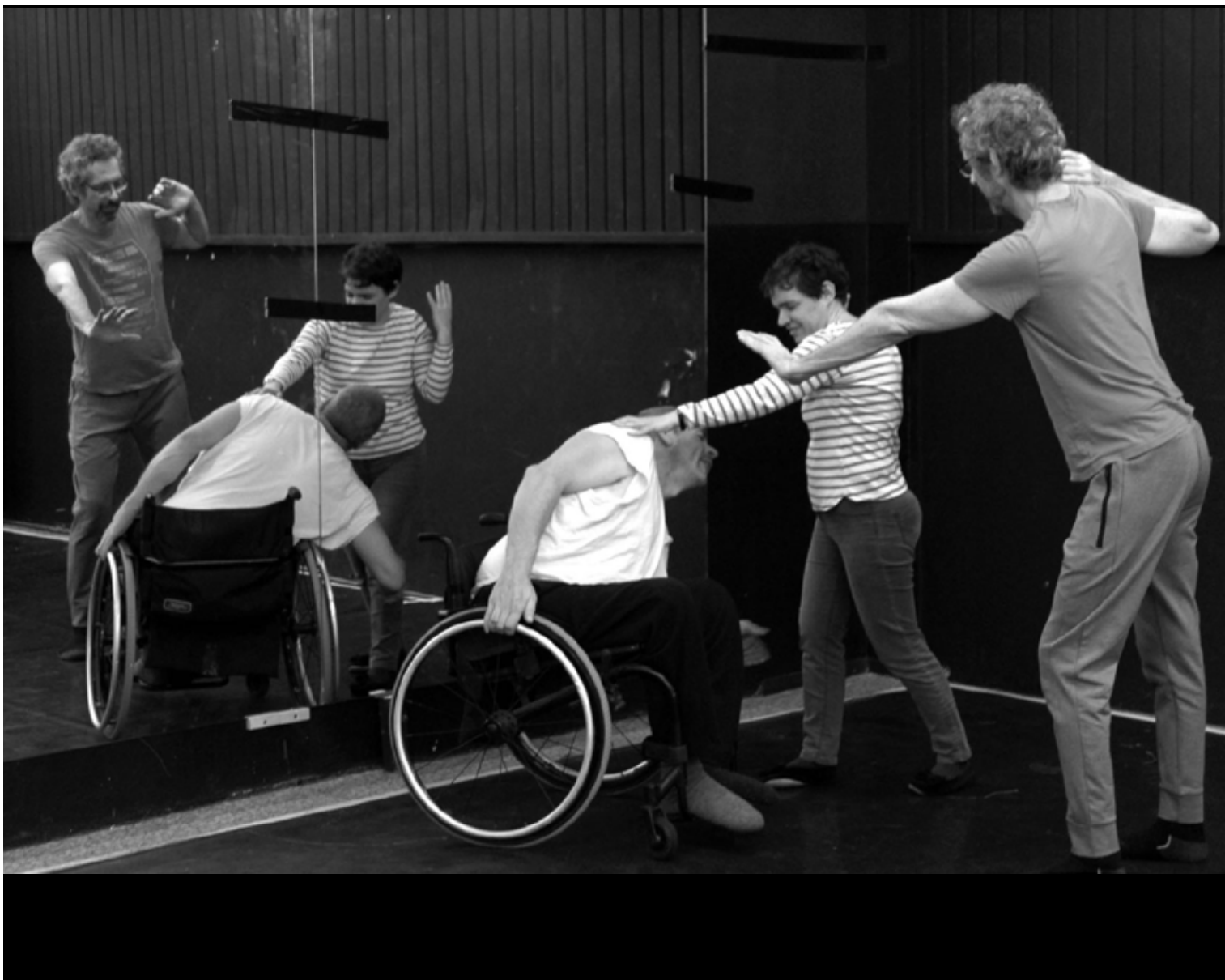
ProdART - Tout va bien / La Mue du Lotus Berlin novembre 2024