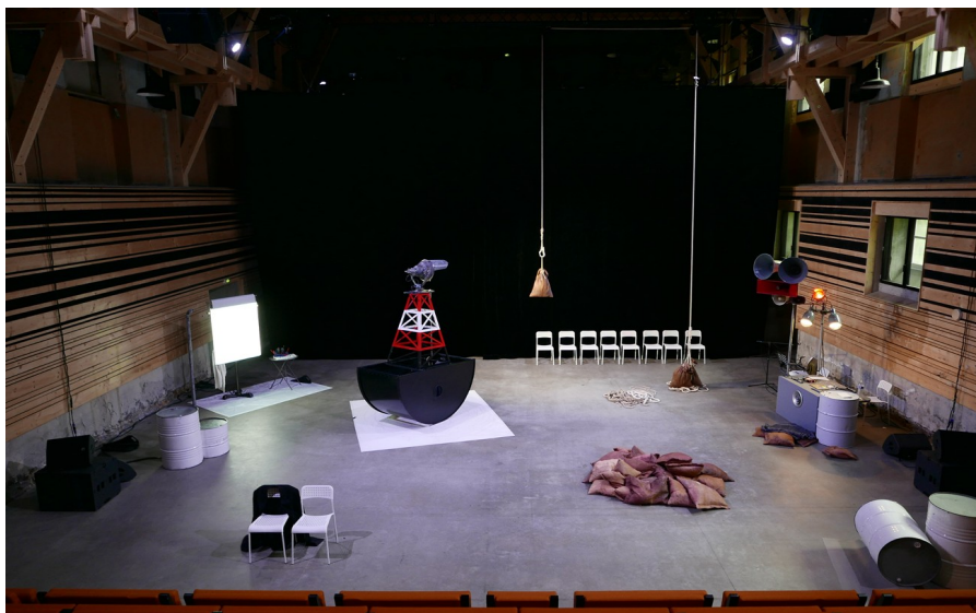
Exemple de plateau au CNCA, à Morlaix, Février 2026 (ouverture : 13m. / profondeur : 9m.)

Certains de ces éléments sont électrifiés. Nous aurons donc besoin de directs et de rallonges suffisantes à leur alimentation.