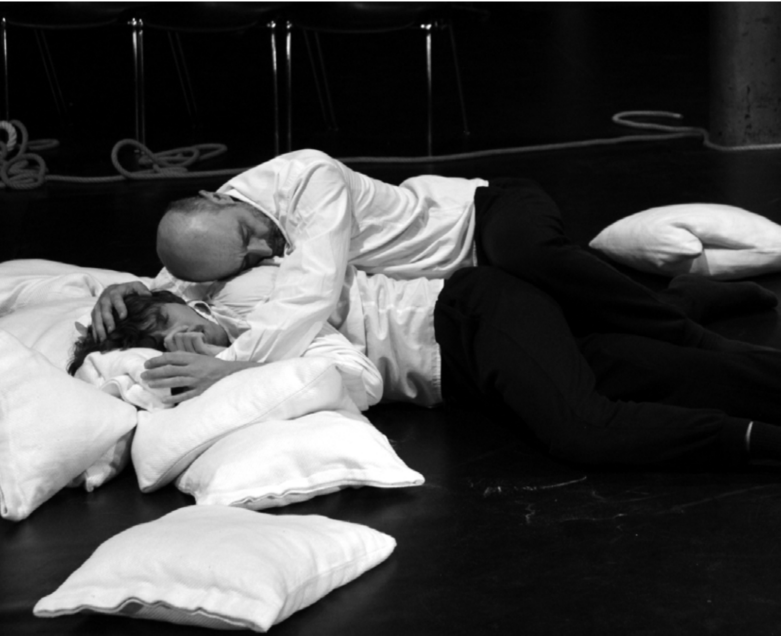
Ateliers INDIGO - Tout va bien / La Mue du Lotus - Bruxelles mai 2025