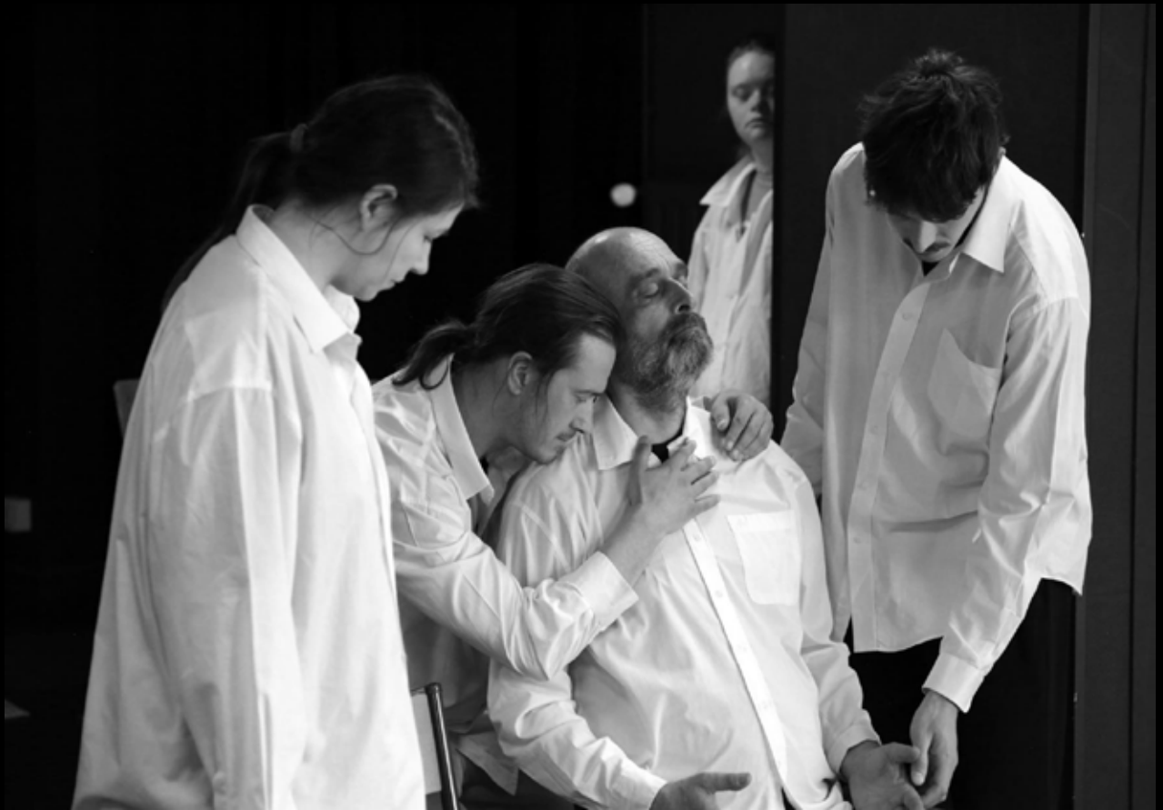
TanzSzene Bremen - Tout va bien / La Mue du Lotus Nancy avril 2025