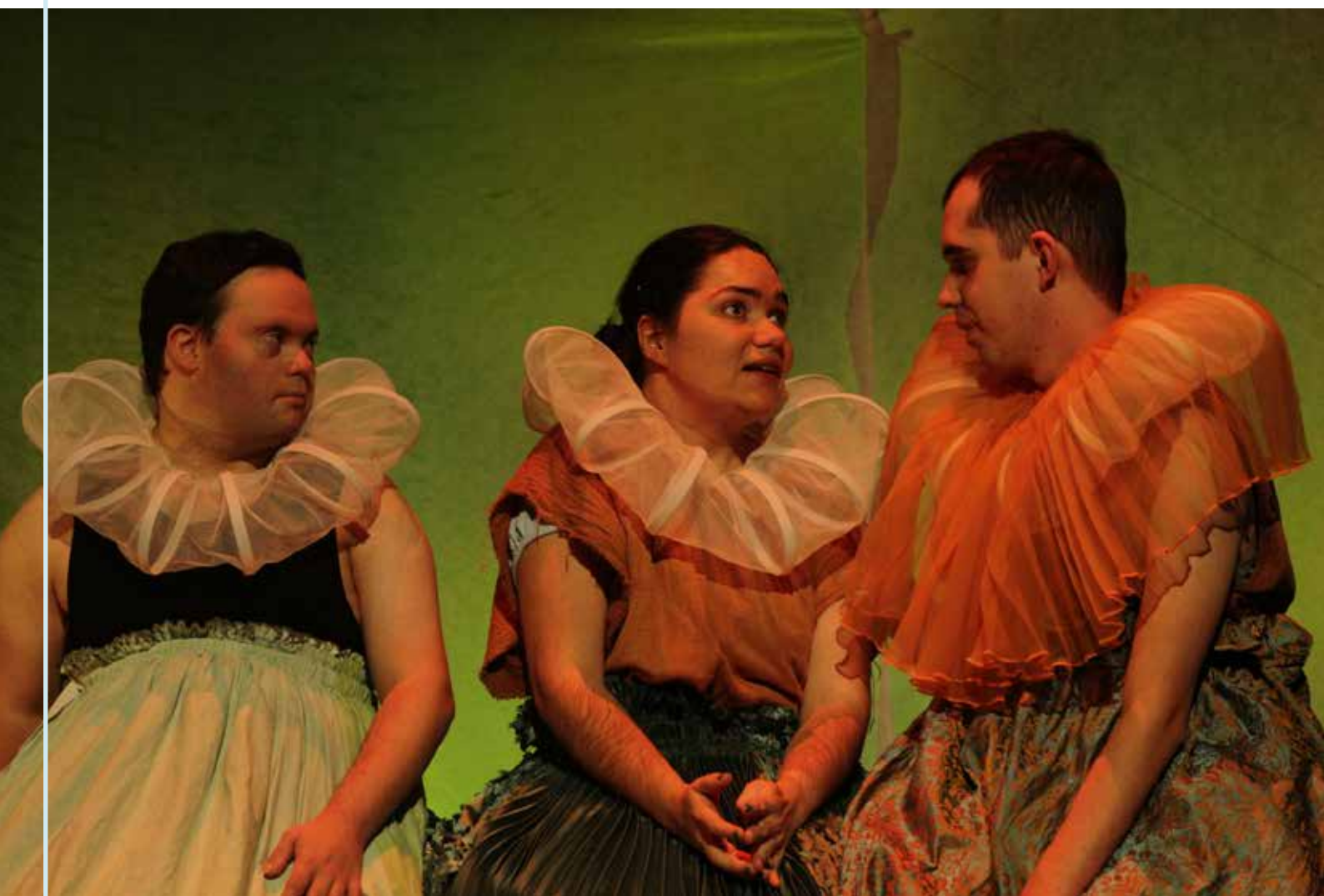
Cie Tout va bien / La Mue du Lotus «Nous, quartier libre»