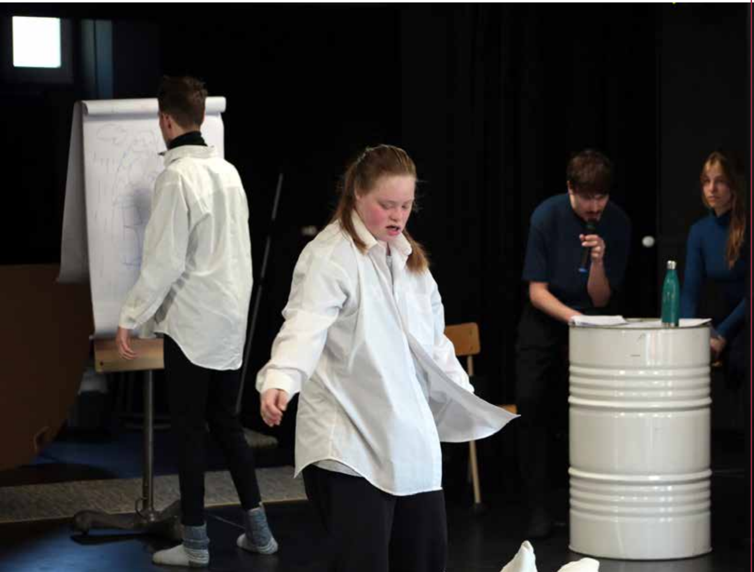
TanzSzene Bremen - Tout va bien/La Mue du Lotus - avril 2025 Nancy