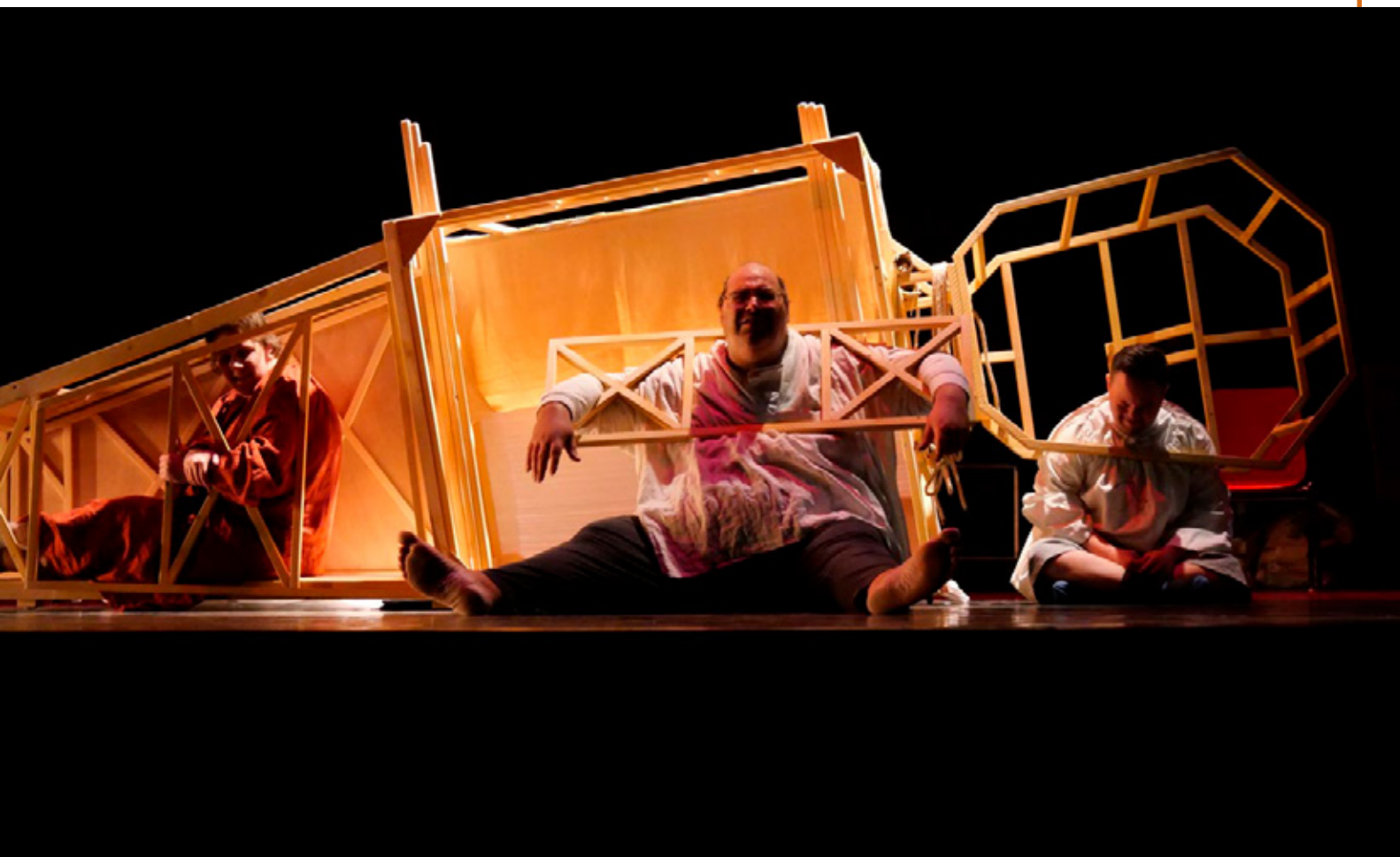
Nous, quartier libre - répétitions Espace 110 à Illzach mars 2024

qui, augmenté de leurs propres mots, nous emmène par un autre chemin à recevoir la richesse de cette singularité humaine.