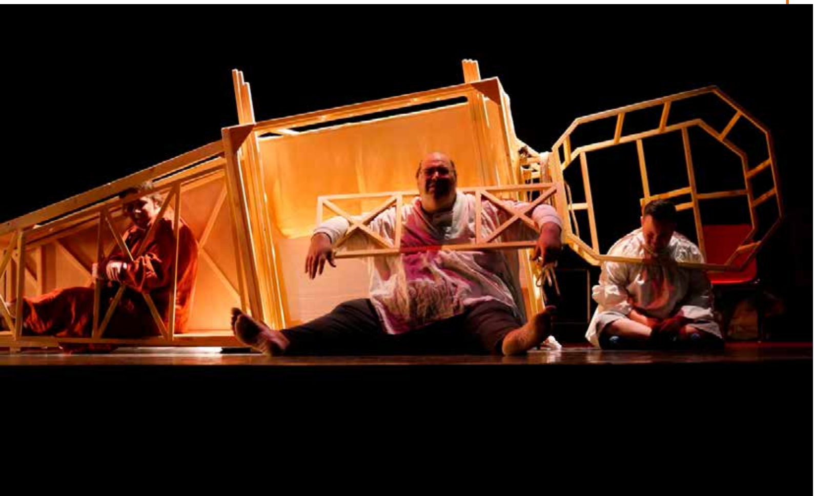
Nous, quartier libre - répétitions Espace 110 à Illzach mars 2024

qui, augmenté de leurs propres mots, nous emmène par un autre chemin à recevoir la richesse de cette singularité humaine.