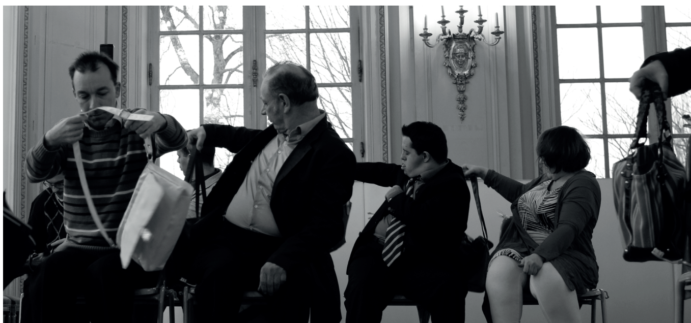
Présentation étape de travail «OH» Foyer de l'Opéra de Nancy - janvier 2017

Il pratique le théâtre depuis 2006. Après plusieurs expériences, il rejoint la compagnie Espo- cible pour la création du spectacle « Oh » sous la direction de Virginie Marouzé.