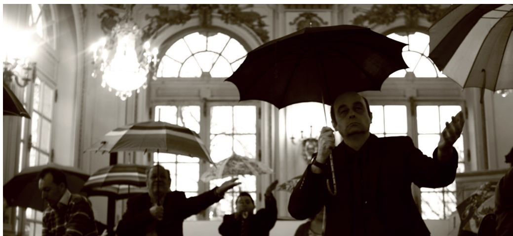
Présentation étape de travail «OH» Foyer de l'Opéra de Nancy - janvier 2017

Implanté à Essey-lès-Nancy, le Cap's est composé d'un Foyer d'Accueil Spécialisé (FAS) de jour et d'un Foyer Intermédiaire (FI). Le Foyer d'Accueil Spécialisé reçoit des personnes adultes handicapées qui suivent alors différents ateliers au quotidien : théâtre, peinture, arts plastiques, cuisine. Chacune d'entre elles doit posséder un minimum d'autonomie dans les gestes essentiels et les actes quotidiens même si cela nécessite parfois un accompagnement.