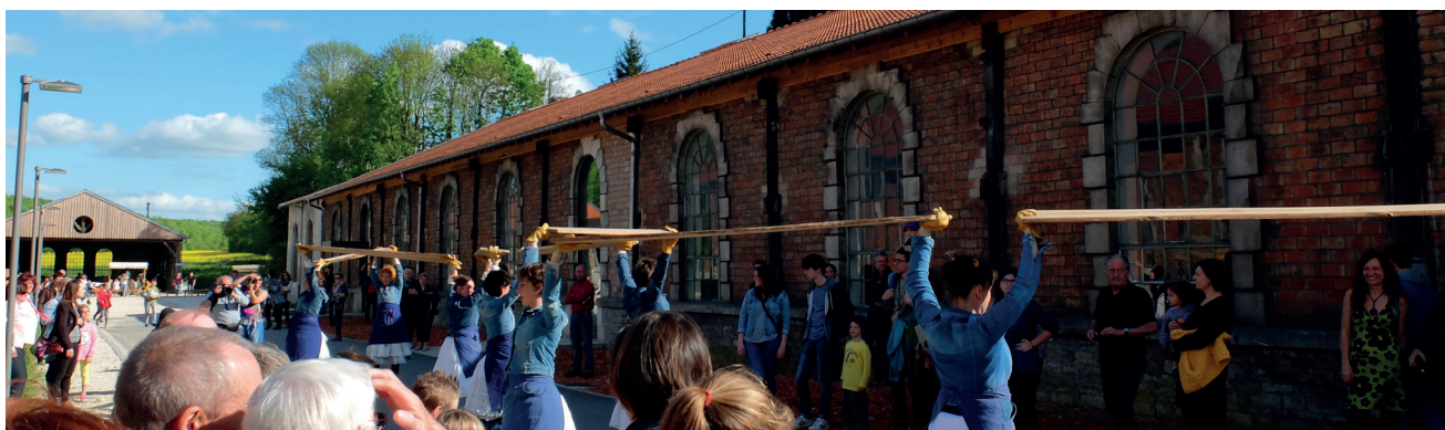
Boots And Roots – Les Clandestines – Ecuirey Pôle d'Avenir – mai 2015

► Création de temps forts : pour ponctuer chacune des phases du projet, des temps forts associant rencontre, présentation des démarches en cours et diffusion de spectacles au répertoire de la compagnie Tout va bien ! ou de compagnies invitées seront proposées.