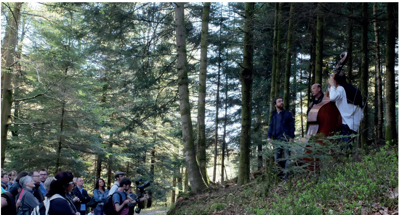
«Une cabane dans la forêt» - conférence citoyenne – Cie La Volige et Cie (Mic)zzaj – Saint Sauveur – Mai 2016

www.scenes-territoires.fr https://vimeo.com/185081998