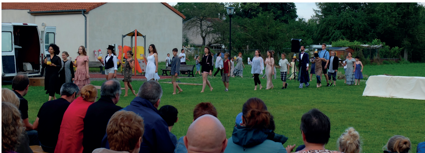
Le Banquet – cie Underclouds – Villers Stoncourt – Juillet 2016

Cette résidence avec Scènes et Territoires implique la présence de la compagnie Tout va bien ! dans des espaces ruraux dépourvus à priori d'une structure professionnelle identifiée et dédiée au spectacle vivant.