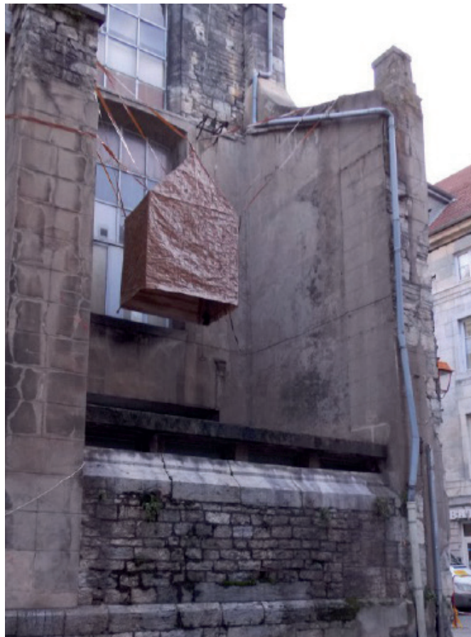
La cabane flottante – maison en scotch / Laurent Mesnier et Guillaume de Baudreuil. Cabane à oiseau géant ? Excroissance du bâtiment ? Abri de nuit éphémère pour poids plume ?

Collectif de trois scénographes, fascinés par la magie des interactions mécaniques et le savant dosage des matières en réactions, ils appréhendent chaque projet comme une leçon de choses. De ces incursions vers des procédés et processus de tout ordre, ils donnent leur lecture, leur projection et inventent engins, sculptures ou scénographies évolutives, vivantes, bruyantes, ludiques et sensorielles, sur des modes et au sein d'espaces de rencontres avec les publics, toujours différents. Le fondement de toutes leurs propositions se trouve dans la quête de perceptions sensorielles. Toutes font sens avec l'espace, l'environnement et ses composantes (architecture, histoire, sons, couleurs, matières, flux passants, ...). Il s'agit de mettre en route un processus perceptif, cherchant à mettre en évidence ce que l'environnement raconte pour que le spectateur se ré-approprié le sens latent, voire le ré-interprète.